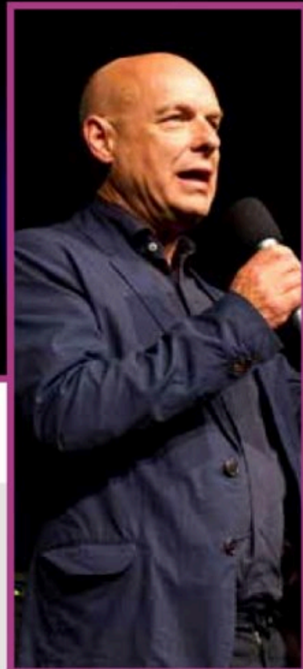
LEGENDE: Brian Eno er Punktfestivalens kurator.

– Det er en flott bygning, og jeg er veldig fascinert av glassveggen. Men jeg har ennå ikke hørt